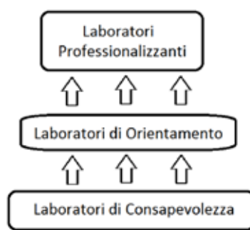
Figura 1 – Progettualità formativa del CPIAS Milano (Elaborazione propria).

Il livello di base riguarda i laboratori di consapevolezza che stimolino la riflessione e l'empatia e che diano allo studente la possibilità di comunicare ed esprimersi attraverso attività come: giochi di ruolo, scrittura creativa, lettura espressiva, teatro, ecc. Questa dimensione risulta imprescindibile e sempre presente, anche nei livelli superiori, lì dove apparentemente risulta ovvia o nascosta.