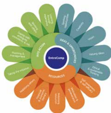
Figura 2 - Le tre aree del EntreComp Entrepreneurship Competence Framework (McCallum, Wiecht, McMullan & Price, 2018, p. 13).

L'idea, dunque, è quella di creare un framework europeo condiviso, in cui tutti gli attori coinvolti in percorsi di entrepreneurship possano riconoscersi attraverso un linguaggio comune. Si puntualizza, in tal senso, come l'acquisizione di un atteggiamento imprenditivo non sia da riferirsi soltanto alla dimensione della generazione di impresa, ma a tutti una serie di ambiti che includono la società civile, le aziende, l'educazione, il lavoro giovanile, le comunità, le start-up e gli stessi percorsi individuali dei soggetti (McCallum, Wiecht, McMullan & Price, 2018, p. 13).