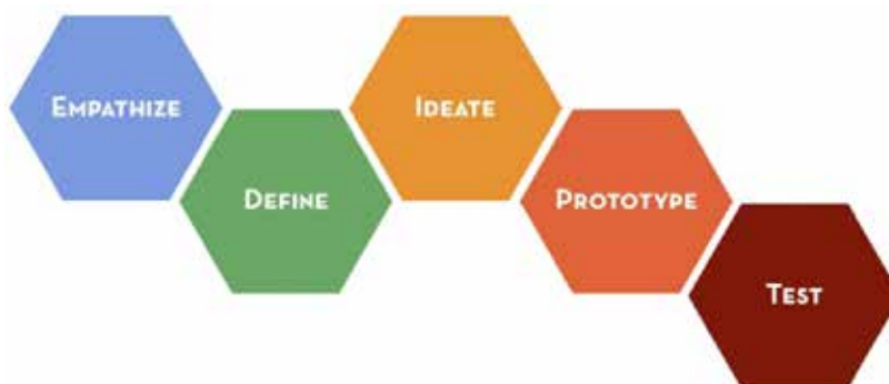
Figura 5 - Modello di Design Thinking elaborato dalla d.school di Stanford ( https://dschool.stanford.edu )

Il concetto, modellizzato dall'Università di Stanford e poi ripreso da numerosi attori in tutto il mondo, è rappresentato dalla seguente figura: