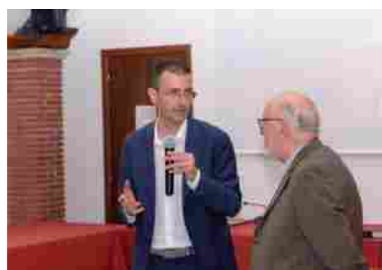
Presentazione del docu-film "40 anni in... Controluce"