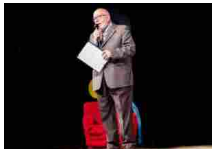
9a Rassegna Teatrale 'Premio Città di Monte Compatri, 1a serata