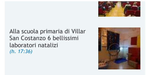
Alla scuola primaria di Villar San Costanzo 6 bellissimi laboratori natalizi (h. 17:36)