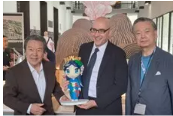
Osaka Expo's mascot Italia-chan debuts at design week