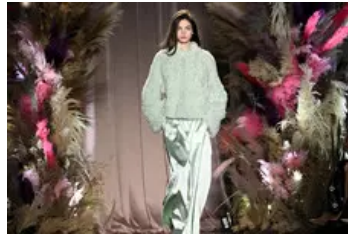
Milan Fashion Week