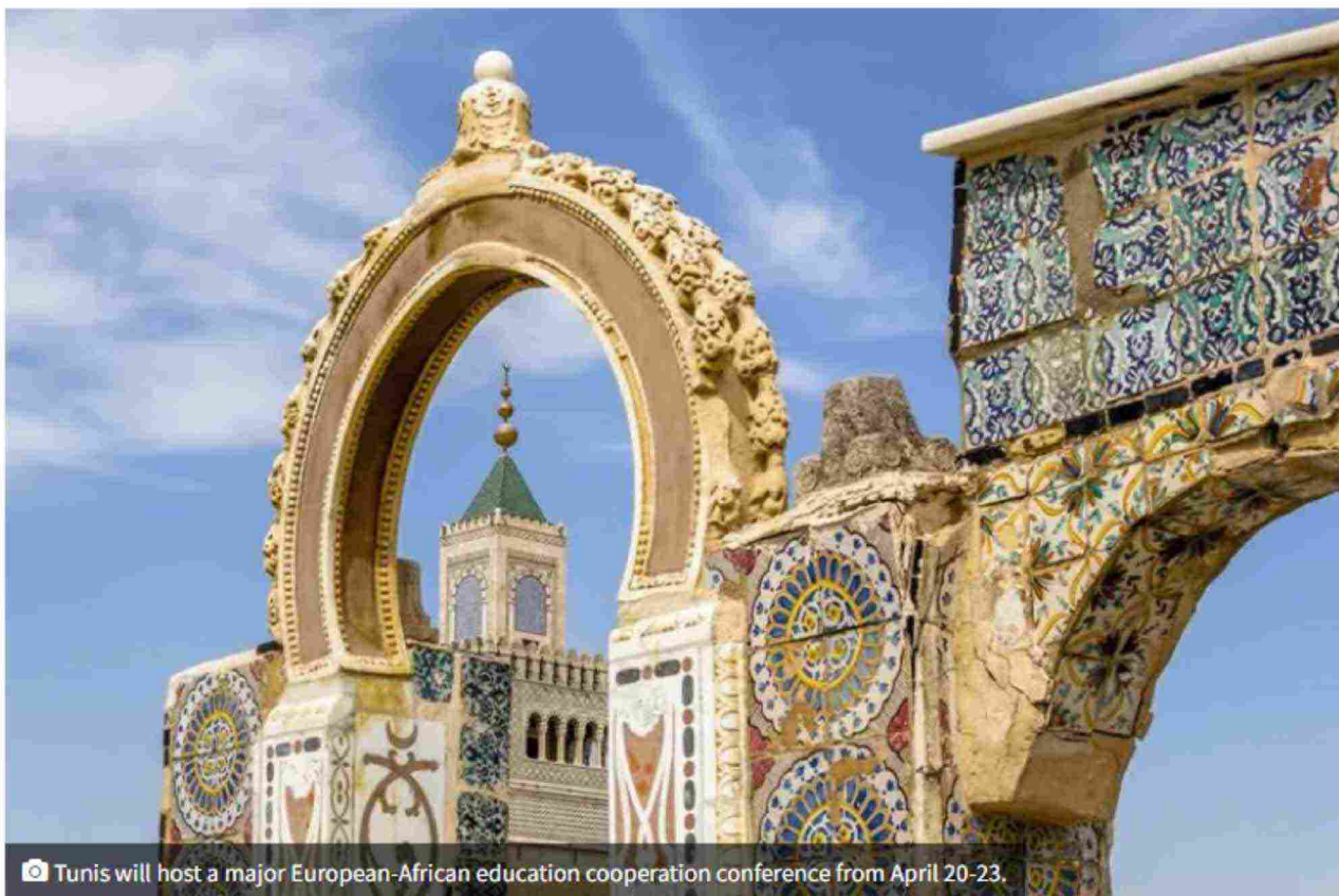
Tunis will host a major European-African education cooperation conference from April 20-23.

Ritaglio stampa ad uso esclusivo del destinatario, non riproducibile.